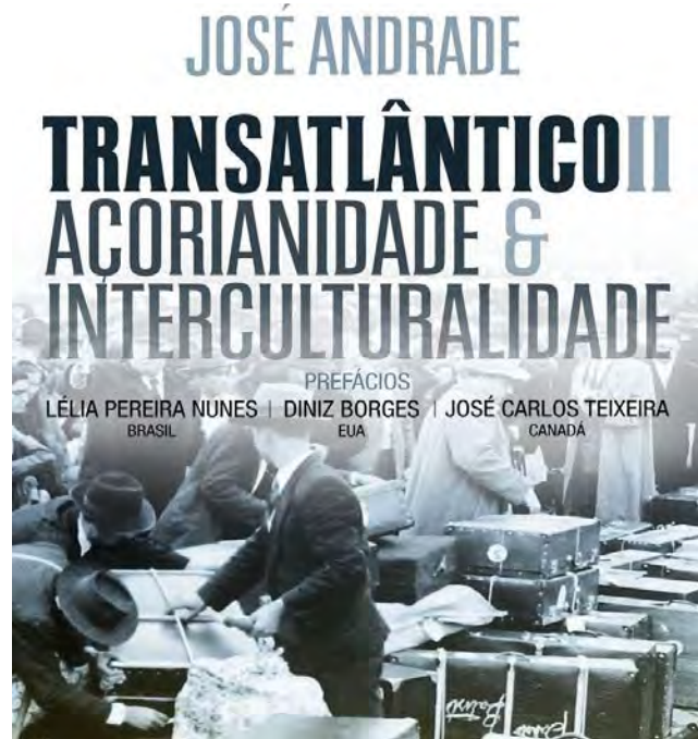
A capa do livro

Tudo isso a pretexto de efemérides açóricas como os 275 anos do povoamento açoriano do Sul do Brasil, os 260 anos da chegada dos açorianos ao Uruguai, os 145 anos da emigração açoriana para o Havai, os 100 anos do nascimento de Natália Correia, os 95 anos da Casa dos Açores em Lisboa, os 80 anos da vinda dos americanos para a Base das Lajes, os 70 anos da emigração oficial dos Açores para o Canadá, os 65 anos do Azorean Refugee Act ou os 25 anos da Direção Regional das Comunidades do Governo dos Açores.