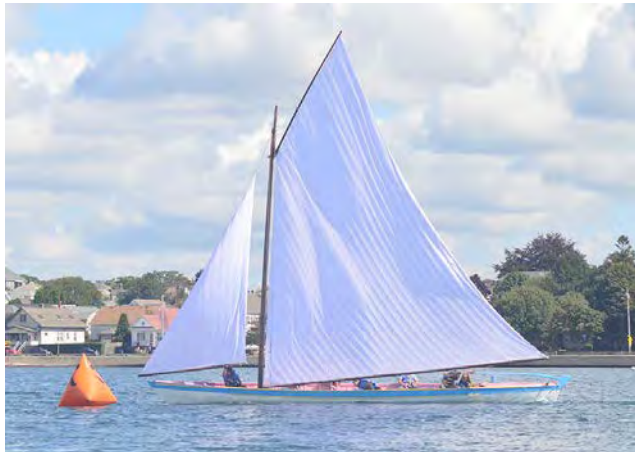
XII Regata Internacional de Botes Baleeiros em New Bedford com equipas do Pico, Faial e EUA.

A Gala dos Amigos da Terça foi um êxito vivo