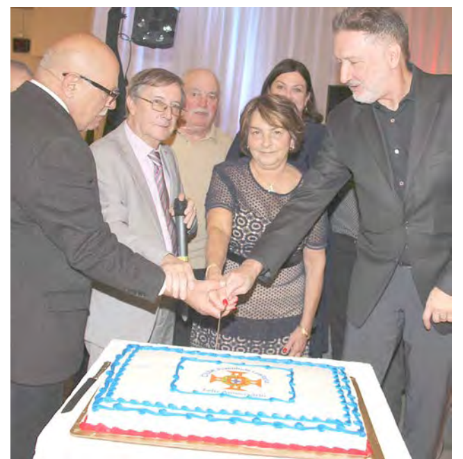
CLUBE JUVENTUDE LUSITANA: 102 anos