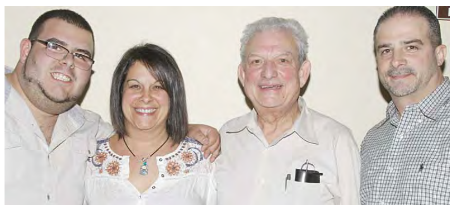
Feliz e Próspero 2024

1337 Cambridge Street, Cambridge, MA (617) 491-3405