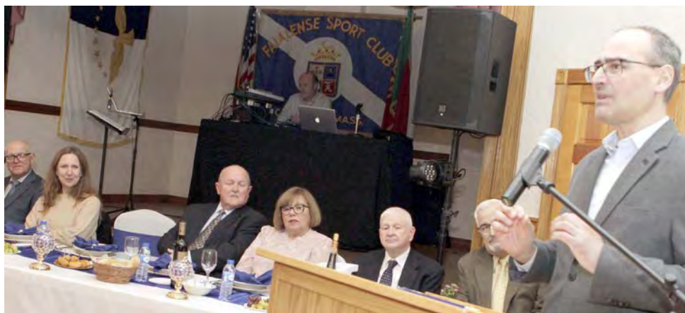
Tiago Araújo, cônsul geral de Portugal em Boston, dirigindo-se aos presentes.