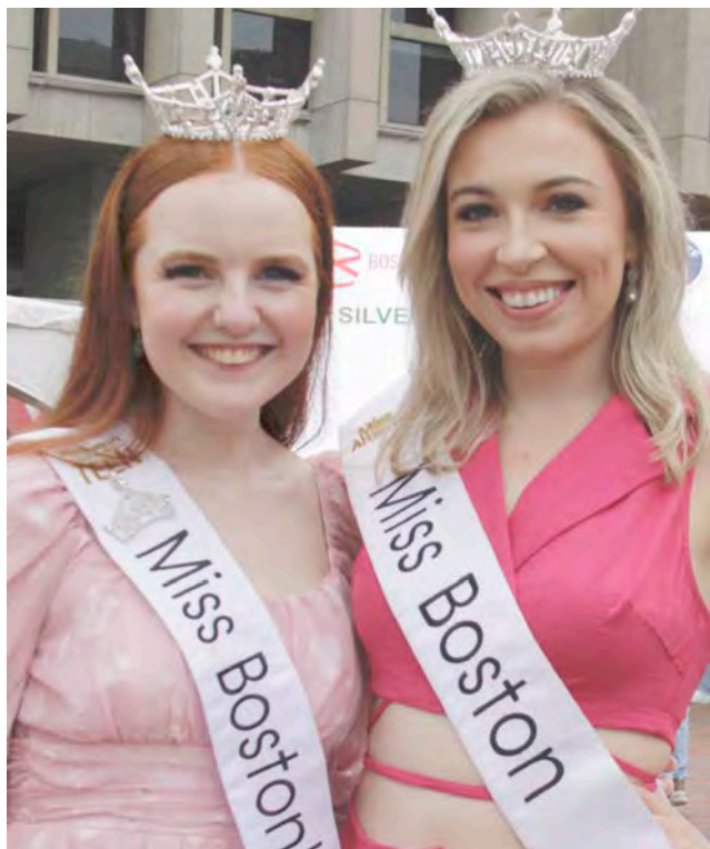
As misses de Boston, na categoria juvenil e sénior, no Boston Portuguese Festival.