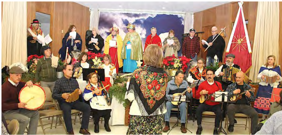
O grupo de instrumentistas e intérpretes que atuou durante a noite de Reis no salão da igreja de Nossa Senhora de Fátima em Cumberland.