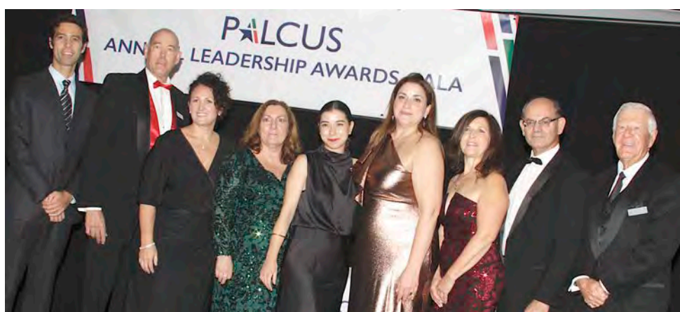
Diretores da PALCUS.