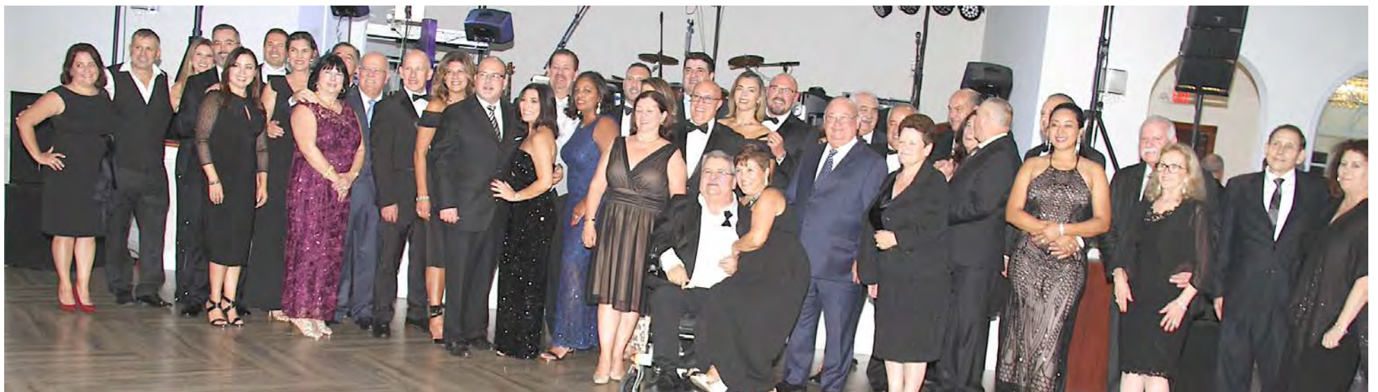
Membros e familiares do grupo Amigos da Terça