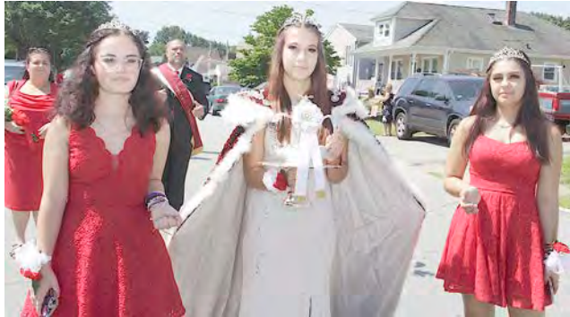
Festa da Irmandade do Espírito Santo do Holy Ghost Brotherhood of Charity, mais popularmente conhecido por Brightridge Club em East Providence.

“Há grandes manifestações da comunidade em vários países, mas direi que esta é aquela que pela sua dinâmica cultural, social, empresarial económi-