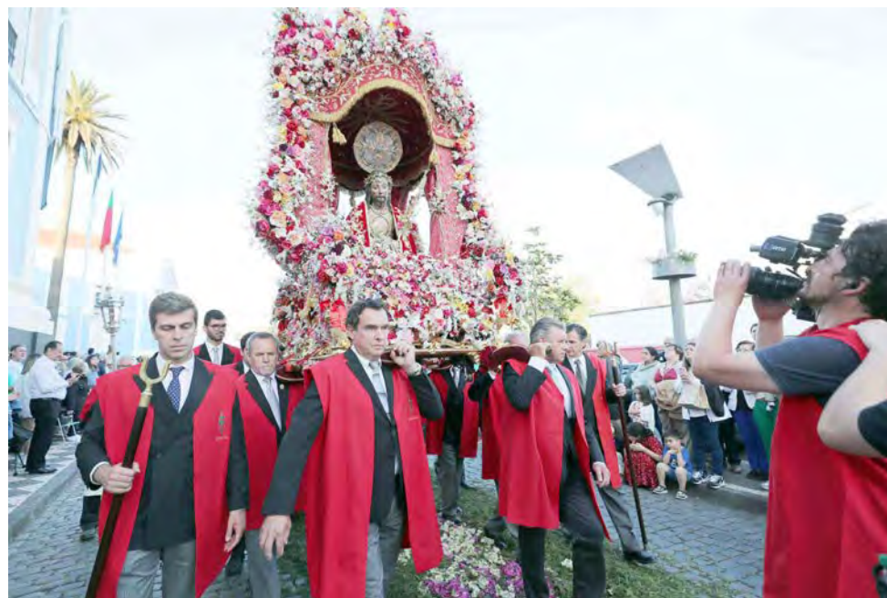
O andor com a imagem do Senhor Santo Cristo dos Milagres em Ponta Delgada, São Miguel, transportado por conhecidos empresários lusoamericanos da Nova Inglaterra.

de relevância na parada do 4 de julho em Bristol