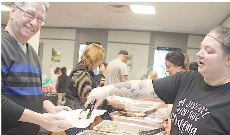
Thanksgiving solidário na Sociedade Cultural Açoriana.