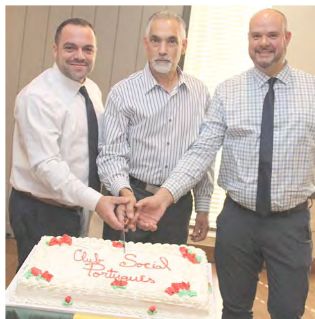
CLUBE SOCIAL PORTUGUÊS: 105 anos

Portugalia Marketplace: 35 anos. O popular supermercado português de Fall