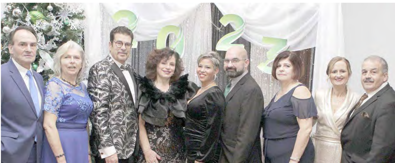
Festa de passagem de ano nos Amigos da Terceira em Pawtucket, RI.

E muito mais num contributo a uma projeção do