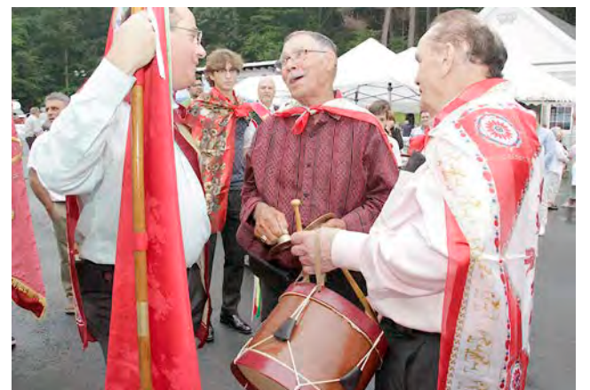
Festa do Império Mariense de Saugus, MA, como sempre muito concorrida.