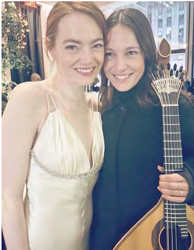
Emma Stone ganhou o Globo de Ouro de Melhor Atriz pelo seu trabalho no filme "Poor Things", onde Carminho canta o fado.

As queixas de Hollywood eram sobretudo por não controlar a organização do prémio e, em junho de 2023, a HFPA vendeu os direitos do Globo de Ouro às produtoras Dick Clark Productions e Eldridge Industries, que produzirão o prémio daqui para a frente.