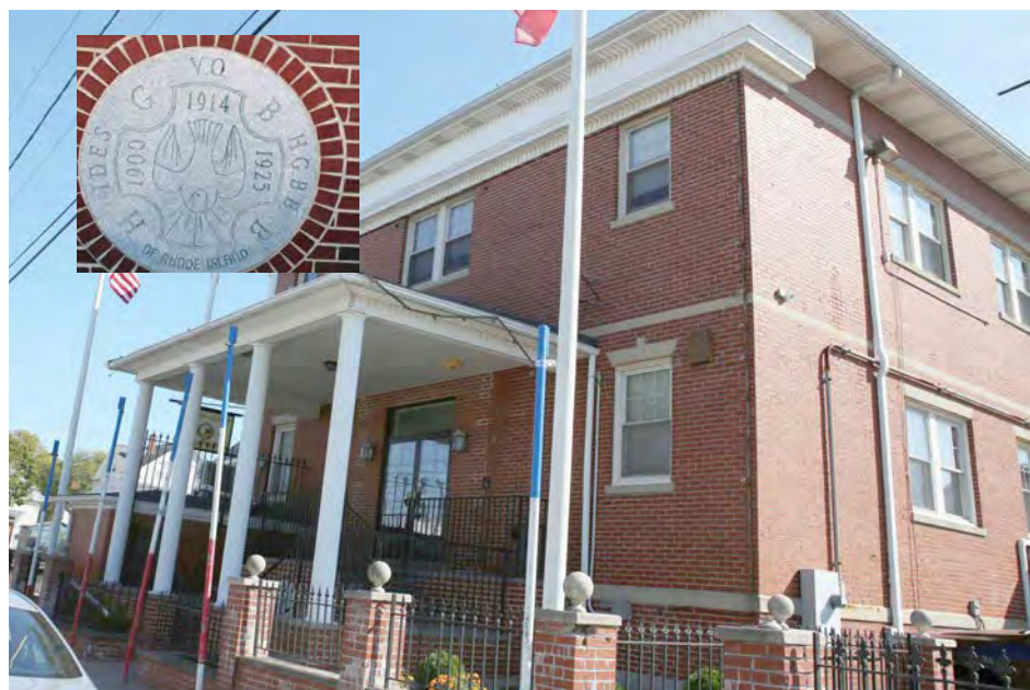
A todo o corpo diretivo, massa associativa Feliz Ano Novo!