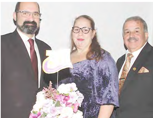
AMIGOS DA TERCEIRA: 35 anos