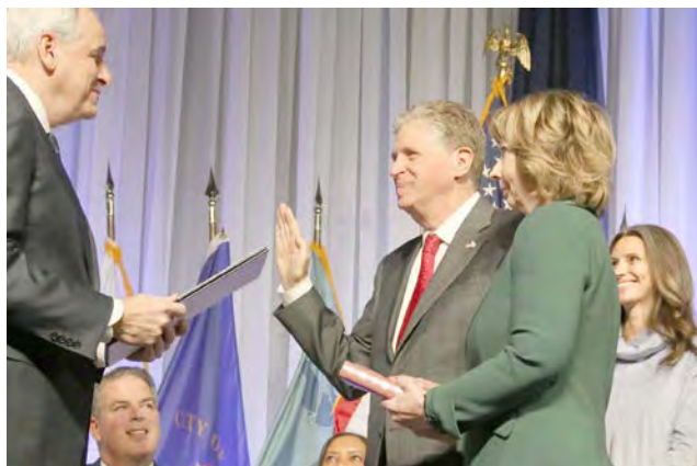
O lusodescendente Peter Neronha, procurador geral de RI, confere posse a Dan McKee como governador de Rhode Island, na foto com a esposa e a filha. A cerimónia realizou-se dia 03 de janeiro, 2023, no Rhode Island Convention Center em Providence.

McKee, que já acompanhou a banda do Clube Juventude Lusitana, numa memorável digressão a