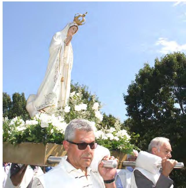
Festas de Nossa Senhora de Fátima em Cumberland, RI (foto acima) e em Ludlow, MA (foto abaixo)