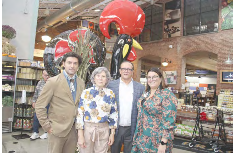
A família Benevides na passagem do 35º aniversário da Portugalia Marketplace.

Portugalia tem mais encanto com o Presépio da Lagoa